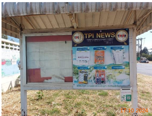
สายตรวจทับกวาง หมู่ 9 ต.ทับกวาง สายตรวจทับกวาง