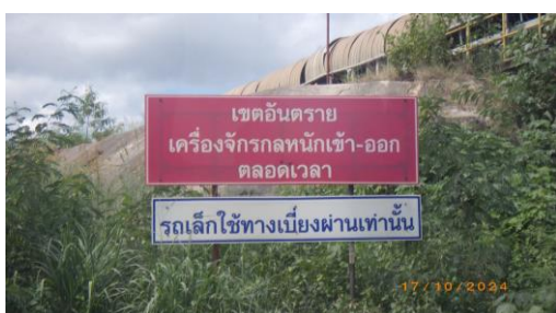
รูปที่ 2-40 ป้ายแสดงห้ามมิให้บุคคลภายนอกที่ไม่มีหน้าที่เกี่ยวข้องเข้ามา