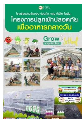
รูปที่ 2-43 สนับสนุนกิจกรรมการปลูกผัก ปลูกต้นไม้ และบำรุงรักษาต้นไม้ภายใน บริเวณโรงเรียนบ้านซับบอน