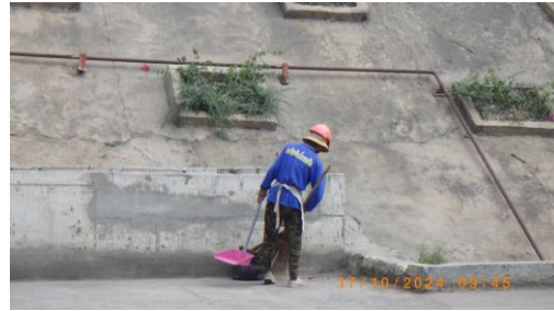
รูปที่ 2-21 พนักงานประจำเพื่อทำความสะอาดลานซีเมนต์ บริเวณโรงงานปูนซีเมนต์