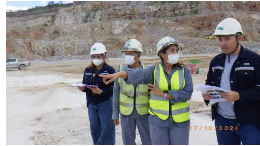
รูปที่ 2-2 การติดตามตรวจสอบตามมาตรการป้องกันและแก้ไขผลกระทบสิ่งแวดล้อม