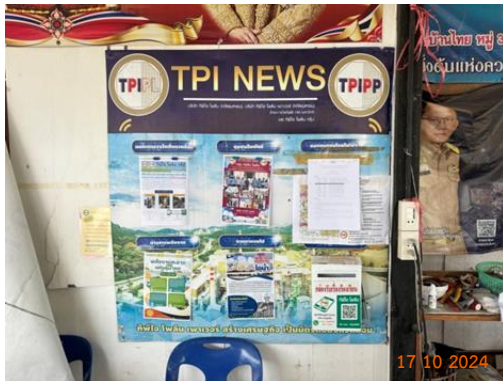
บ้านผู้ใหญ่ หมู่ 3 ต.ทับกวาง ที่ทำการผู้ใหญ่บ้าน ม.3

โครงการเหมืองแร่หินอุตสาหกรรมชนิดหินปูน เพื่ออุตสาหกรรมปูนซีเมนต์ สำหรับแปลงคำขอประทานบัตรที่ 12/2556 ร่วมแผนผังโครงการทำเหมืองเดียวกัน กับคำขอประทานบัตรที่ 13/2556, คำขอประทานบัตรที่ 14/2556, คำขอประทานบัตรที่ 15/2556, คำขอประทานบัตรที่ 16/2556 และคำขอประทานบัตรที่ 17/2556 และประทานบัตรที่ 27340/14390 ประทานบัตรที่ 27341/14391 และประทานบัตรที่ 27348/14392 ของบริษัท ทีพีโอ โพลีน จำกัด (มหาชน) ระหว่างเดือนกรกฎาคม-ธันวาคม พ.ศ. 2567