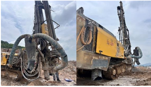
รูปที่ 2-7 เครื่องเจาะระเบิดที่มีระบบ Cyclone และถุงกรอง

โครงการเหมืองแร่หินอุตสาหกรรมชนิดหินปูน เพื่ออุตสาหกรรมปูนซีเมนต์ สำหรับแปลงคำขอประทานบัตรที่ 12/2556 รวมแผนผังโครงการทำเหมืองเดียวกันกับคำขอประทานบัตรที่ 13/2556, คำขอประทานบัตรที่ 14/2556, คำขอประทานบัตรที่ 15/2556, คำขอประทานบัตรที่ 16/2556 และคำขอประทานบัตรที่ 17/2556 และประทานบัตรที่ 27340/14390 ประทานบัตรที่ 27341/14391 และประทานบัตรที่ 27348/14392 ของบริษัท ทีพีโอ โพลีน จำกัด (มหาชน) ระหว่างเดือนกรกฎาคม-ธันวาคม พ.ศ. 2567