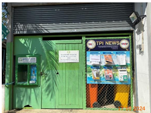
ศาลาประชาคม หมู่ 10 ต.มิตรภาพ

ของบริษัท ทีพีโอ โพลีน จำกัด (มหาชน) ระหว่างเดือนกรกฎาคม-ธันวาคม พ.ศ. 2567