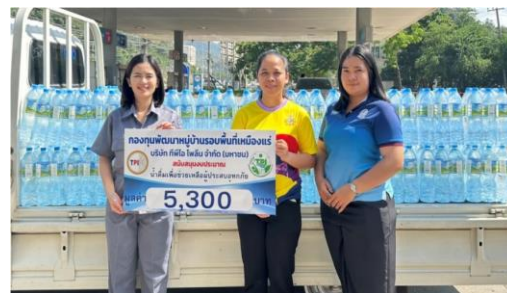
รูปที่ 2-33 การสนับสนุนกิจกรรมชุมชน