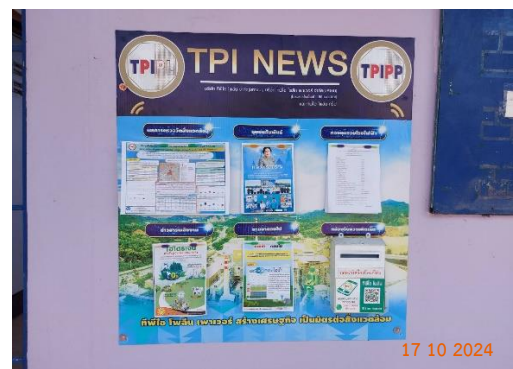
รูปที่ 2-45 เจ้าหน้าที่ลงพื้นที่รับซื้อร้องเรียน และจัดทำกล่องรับเรื่องร้องเรียน