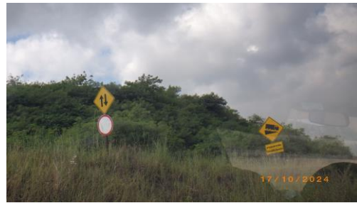
รูปที่ 2-32 ป้ายสัญญาณเตือนภัย บริเวณพื้นที่โครงการ