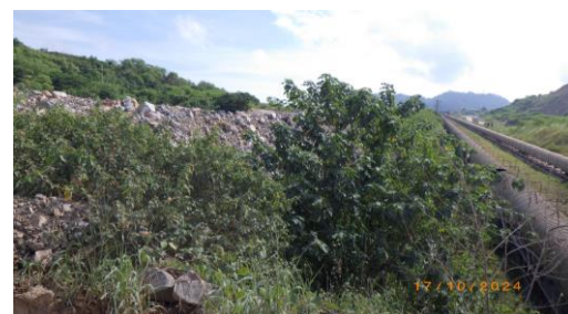
รูปที่ 2-38 ปฏิกิริยาของดินบริเวณพื้นที่โครงการ