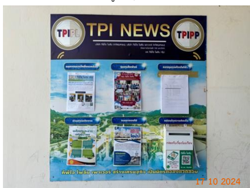
ศาลาประชาคม หมู่ 4 ต.มิตรภาพ