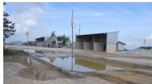
รูปที่ 2-17 บริเวณสำหรับการทำความสะอาดดินเศษโคลนที่ติดตามรถบรรทุกแร่