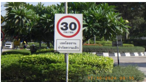
รูปที่ 2-16 ป้ายกำหนดความเร็วของยานพาหนะในพื้นที่โครงการ ไม่เกิน 30 กม./ชม.