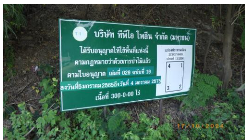
รูปที่ 2-5 ป้ายแสดงรายละเอียดของแปลงประทานบัตรบริเวณพื้นที่โครงการ