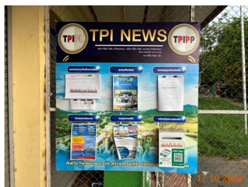
ศาลาประชาคม หมู่ 5 ต.มิตรภาพ