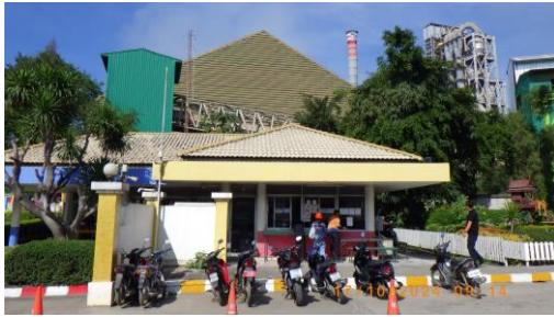
รูปที่ 2-1 อาคารติดต่อและรับเรื่องร้องทุกข์ของบริษัท

โครงการเหมืองแร่หินอุตสาหกรรมชนิดหินปูน เพื่ออุตสาหกรรมปูนซีเมนต์ สำหรับแปลงคำขอประทานบัตรที่ 12/2556 ร่วมแผนผังโครงการทำเหมืองเดียวกันกับคำขอประทานบัตรที่ 13/2556, คำขอประทานบัตรที่ 14/2556, คำขอประทานบัตรที่ 15/2556, คำขอประทานบัตรที่ 16/2556 และคำขอประทานบัตรที่ 17/2556 และประทานบัตรที่ 27340/14390 ประทานบัตรที่ 27341/14391 และประทานบัตรที่ 27348/14392 ของบริษัท ทีพีโอ โพลีน จำกัด (มหาชน) ระหว่างเดือนกรกฎาคม-ธันวาคม พ.ศ. 2567