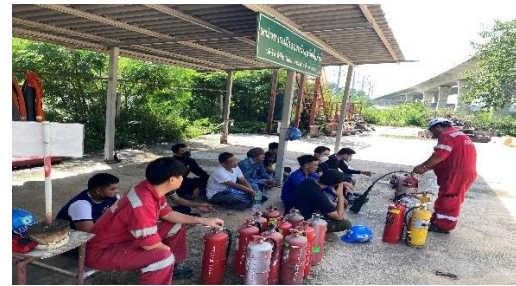
รูปที่ 2-35 การอบรมแก่พนักงานและผู้ควบคุมการดำเนินงาน ในเรื่องอาชีวอนามัยและความปลอดภัย