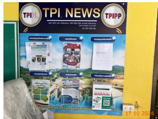
บ้านผู้ใหญ่ หมู่ 10 ต.ทับกวาง ที่ทำการผู้ใหญ่บ้าน ม.10