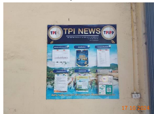
วัดชัยประดิษฐ์ หมู่ 6 ต.มวกเหล็ก วัดชัยประดิษฐ์