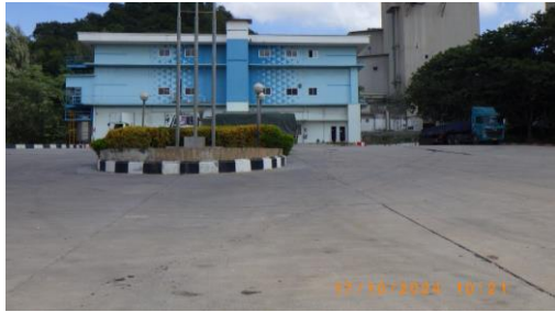
รูปที่ 2-20 พื้นที่สำหรับจอดรถบรรทุก รับ-ส่งวัตถุดิบในการผลิตซีเมนต์

โครงการเหมืองแร่หินอุตสาหกรรมชนิดหินปูน เพื่ออุตสาหกรรมปูนซีเมนต์ สำหรับแปลงคำขอประทานบัตรที่ 12/2556 ร่วมแผนผังโครงการทำเหมืองเดียวกัน กับคำขอประทานบัตรที่ 13/2556, คำขอประทานบัตรที่ 14/2556, คำขอประทานบัตรที่ 15/2556, คำขอประทานบัตรที่ 16/2556 และคำขอประทานบัตรที่ 17/2556 และประทานบัตรที่ 27340/14390 ประทานบัตรที่ 27341/14391 และประทานบัตรที่ 27348/14392 ของบริษัท ทีพีโอ โพลีน จำกัด (มหาชน) ระหว่างเดือนกรกฎาคม-ธันวาคม พ.ศ. 2567