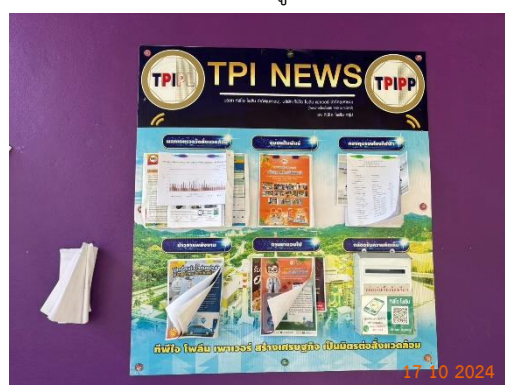
ศาลาประชาคม หมู่ 7 ต.มิตรภาพ

รูปที่ 2-39 (ต่อ) การประชาสัมพันธ์ข้อมูลให้ประชาชนในชุมชนใกล้เคียงและหน่วยงานสาธารณสุข