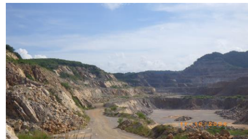
รูปที่ 2-4 สภาพปัจจุบันของพื้นที่การทำเหมืองแร่หินปูน