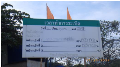
รูปที่ 2-24 ป้ายแจ้งวัน-เวลาระเบิด