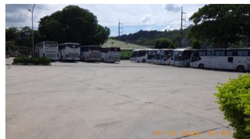
รูปที่ 2-19 ลานคอนกรีตเสริมเหล็กบริเวณโรงงานปูนซีเมนต์และลานจอดรถบรรทุก