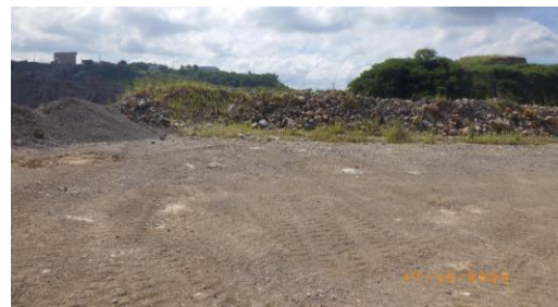
รูปที่ 2-47 การเก็บกวาดเศษหินและเศษดิน ก่อนการระเบิดหน้าเหมือง