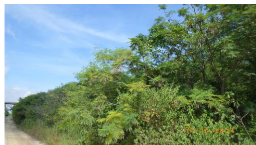
รูปที่ 2-13 การปลูกไม้ยืนต้นโตเร็วประจำถิ่น บริเวณขอบเขตพื้นที่โรงโม่บด และย่อยหิน