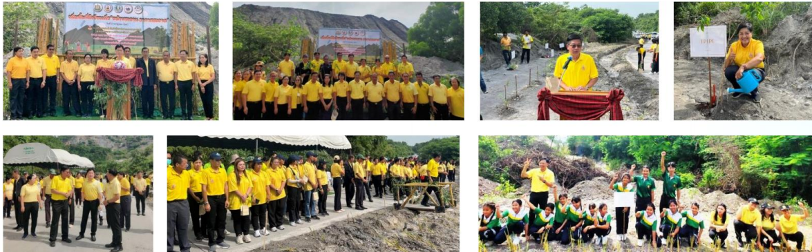
โครงการเพิ่มพื้นที่สีเขียวเพื่อหน้าพระลาน

โครงการเหมืองแร่หินอุตสาหกรรมชนิดหินปูน เพื่ออุตสาหกรรมปูนซีเมนต์ สำหรับแปลงคำขอประทานบัตรที่ 12/2556 ร่วมแผนผังโครงการทำเหมืองเดียวกันกับคำขอประทานบัตรที่ 13/2556, คำขอประทานบัตรที่ 14/2556, คำขอประทานบัตรที่ 15/2556, คำขอประทานบัตรที่ 16/2556 และคำขอประทานบัตรที่ 17/2556 และประทานบัตรที่ 27340/14390 ประทานบัตรที่ 27341/14391 และประทานบัตรที่ 27348/14392 ของบริษัท ทีพีโอ โพลีน จำกัด (มหาชน) ระหว่างเดือนกรกฎาคม-ธันวาคม พ.ศ. 2567