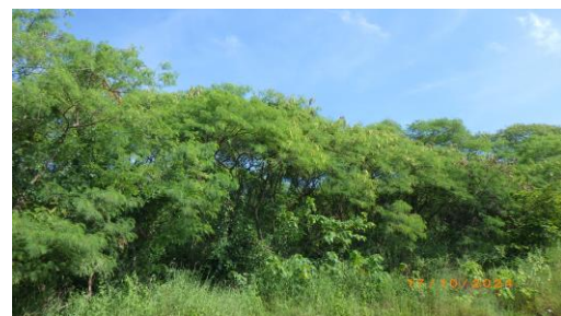
รูปที่ 2-6 การปลูกต้นไม้ทรงสูงตามแนวเส้นทางขนส่งแร่ บริเวณพื้นที่โครงการ