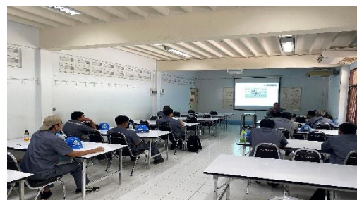
รูปที่ 2-30 การจัดอบรมพนักงานขับรถบรรทุกแร่