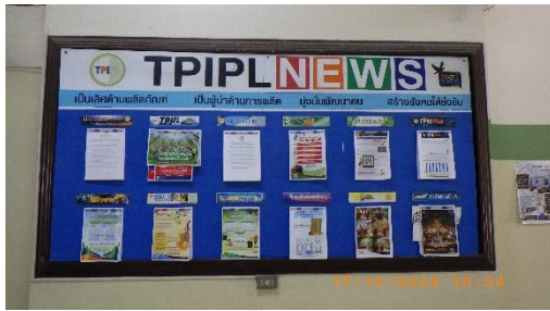
รูปที่ 2-34 บอร์ดประชาสัมพันธ์ แสดงเกี่ยวกับข้อมูลโครงการ

โครงการเหมืองแร่หินอุตสาหกรรมชนิดหินปูน เพื่ออุตสาหกรรมปูนซีเมนต์ สำหรับแปลงคำขอประทานบัตรที่ 12/2556 ร่วมแผนผังโครงการทำเหมืองเดียวกันกับคำขอประทานบัตรที่ 13/2556, คำขอประทานบัตรที่ 14/2556, คำขอประทานบัตรที่ 15/2556, คำขอประทานบัตรที่ 16/2556 และคำขอประทานบัตรที่ 17/2556 และประทานบัตรที่ 27340/14390 ประทานบัตรที่ 27341/14391 และประทานบัตรที่ 27348/14392 ของบริษัท ทีพีโอ โพลีน จำกัด (มหาชน) ระหว่างเดือนกรกฎาคม-ธันวาคม พ.ศ. 2567