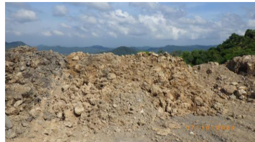
รูปที่ 2-28 เขตพื้นที่กันชน (Buffer zone)