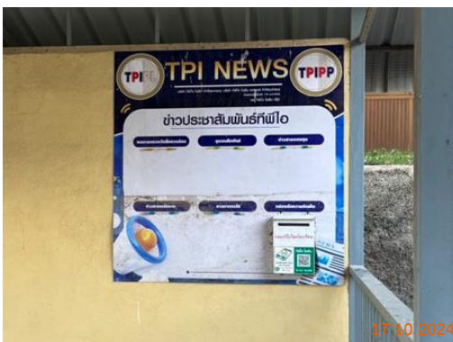
บ้านผู้ใหญ่ หมู่ 5 ต.มวกเหล็ก วัดหินลับ