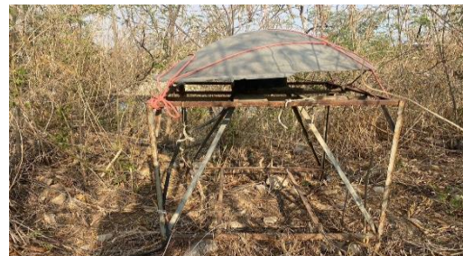
รูปที่ 2-23 หอสัญญาณเตือน