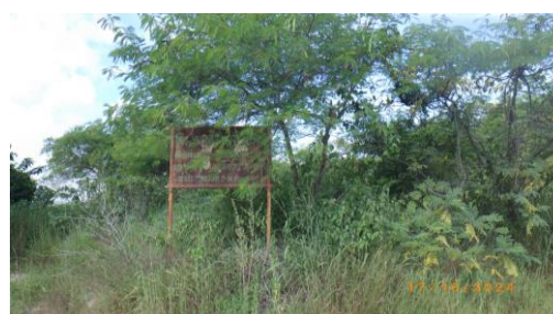
รูปที่ 2-41 การฟื้นฟูพื้นที่ที่ผ่านการทำเหมือง