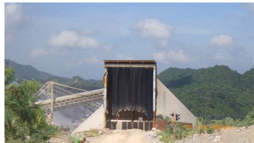
รูปที่ 2-10 เครื่องย่อยหินปูน (Limestone Crusher)