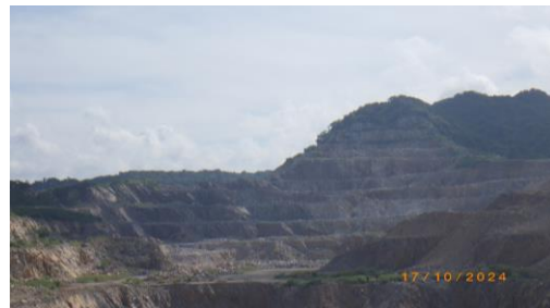
รูปที่ 2-25 ลักษณะการทำเหมืองแบบขั้นบันได