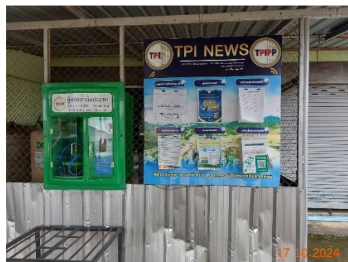
วัดท่าเสา หมู่ 13 ต.มวกเหล็ก วัดท่าเสา