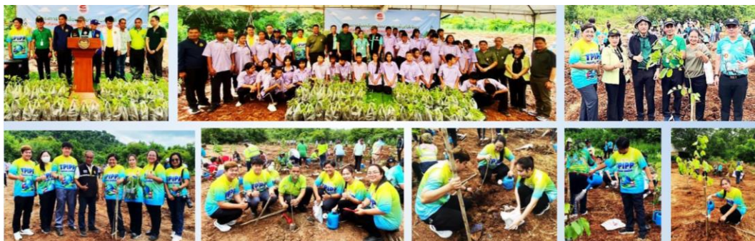
โครงการสร้างขับเคลื่อนนโยบายเพิ่มพื้นที่สีเขียว