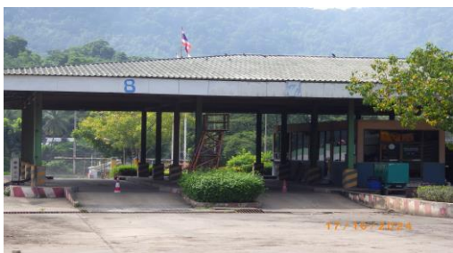
รูปที่ 2-18 เครื่องชั่งน้ำหนักบริเวณประตูที่ 3