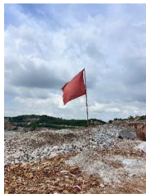
รูปที่ 2-22 รุระเบิดหน้าเหมือง (Burden Distance)