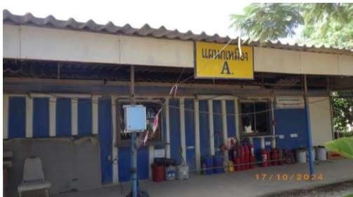
รูปที่ 2-27 สถานที่เก็บเครื่องมือและอุปกรณ์บริเวณพื้นที่โครงการ