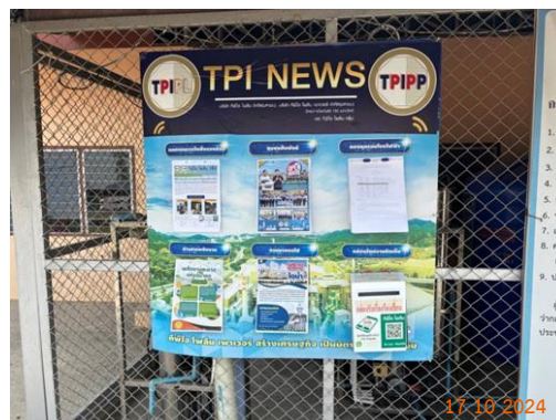
ศาลาประชาคม หมู่ 2 ต.ท่าคล้อ