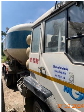
รูปที่ 2-31 เบอร์โทรศัพท์ หรือรายละเอียดที่สามารถ แจ้งข้อร้องเรียนที่เห็นชัดเจน ข้างรถบรรทุกแร่ของ โครงการ

โครงการเหมืองแร่หินอุตสาหกรรมชนิดหินปูน เพื่ออุตสาหกรรมปูนซีเมนต์ สำหรับแปลงคำขอประทานบัตรที่ 12/2556 ร่วมแผนผังโครงการทำเหมืองเดียวกัน กับคำขอประทานบัตรที่ 13/2556, คำขอประทานบัตรที่ 14/2556, คำขอประทานบัตรที่ 15/2556, คำขอประทานบัตรที่ 16/2556 และคำขอประทานบัตรที่ 17/2556 และประทานบัตรที่ 27340/14390 ประทานบัตรที่ 27341/14391 และประทานบัตรที่ 27348/14392 ของบริษัท ทีพีโอ โพลีน จำกัด (มหาชน) ระหว่างเดือนกรกฎาคม-ธันวาคม พ.ศ. 2567