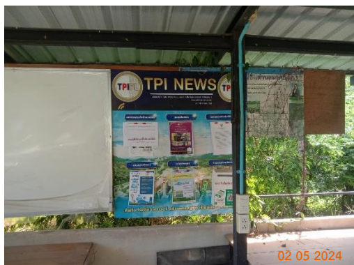
บ้านผู้ใหญ่ หมู่ 12 ต.มวกเหล็ก ที่ทำการผู้ใหญ่บ้าน ม.12

ของบริษัท ทีพีโอ โพลีน จำกัด (มหาชน) ระหว่างเดือนกรกฎาคม-ธันวาคม พ.ศ. 2567