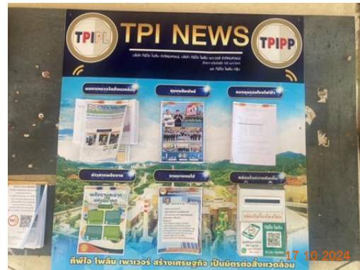
วัดชัยบอน หมู่ 5 ต.ทับกวาง ศาลาชุมชนบ้านชัยบอน