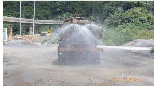
รูปที่ 2-8 การฉีดพรมน้ำ บริเวณพื้นที่โครงการ