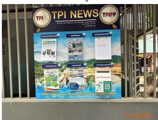
ศาลาประชาคม หมู่ 6 ต.มิตรภาพ