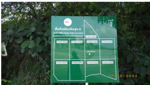
รูปที่ 2-3 ป้ายแสดงแผนผังพื้นที่โครงการ