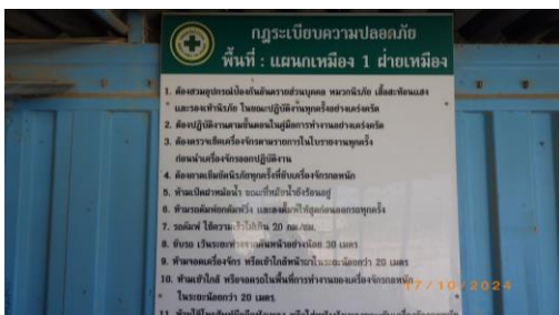
รูปที่ 2-29 ป้ายประกาศด้านความปลอดภัยและข่าวสารต่างๆ ในพื้นที่เหมือง