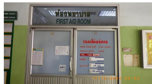
รูปที่ 2-37 ห้องพยาบาลและรถพยาบาลฉุกเฉิน