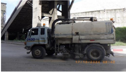
รูปที่ 2-14 รถดูดฝุ่นทำความสะอาดฝุ่นบริเวณลานหน้าประตู 3

โครงการเหมืองแร่หินอุตสาหกรรมชนิดหินปูน เพื่ออุตสาหกรรมปูนซีเมนต์ สำหรับแปลงคำขอประทานบัตรที่ 12/2556 ร่วมแผนผังโครงการทำเหมืองเดียวกันกับคำขอประทานบัตรที่ 13/2556, คำขอประทานบัตรที่ 14/2556, คำขอประทานบัตรที่ 15/2556, คำขอประทานบัตรที่ 16/2556 และคำขอประทานบัตรที่ 17/2556 และประทานบัตรที่ 27340/14390 ประทานบัตรที่ 27341/14391 และประทานบัตรที่ 27348/14392 ของบริษัท ทีพีโอ โพลีน จำกัด (มหาชน) ระหว่างเดือนกรกฎาคม-ธันวาคม พ.ศ. 2567