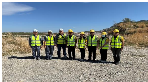
รูปที่ 2-46 การเข้าศึกษาดูงานในพื้นที่ของโครงการ