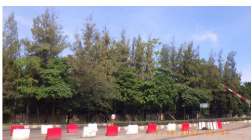
รูปที่ 2-42 ไม้ยืนต้นขนาดใหญ่บริเวณขอบเขตพื้นที่โครงการที่ต่อเนื่องกับโรงเรียนบ้านซับบอน