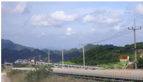
รูปที่ 2-9 โรงย่อยหินแบบ Semi Mobile Crusher