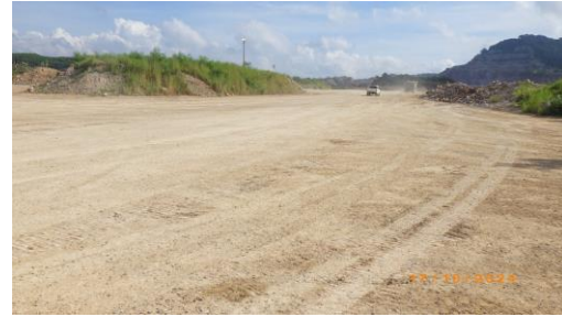
รูปที่ 2-15 ใช้ประโยชน์มูลดินในการปรับปรุงไหล่ทาง และเส้นทางบริเวณหน้าเหมือง