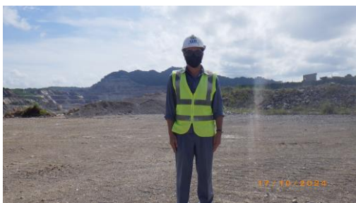
รูปที่ 2-12 การสวมใส่อุปกรณ์ป้องกันอันตรายส่วนบุคคลของพนักงาน